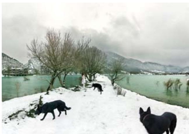
Cecilia de Val The wolves, 2009 Serie: «El otro reino» Lambda print. 131x178 cm.

universo doloroso de la pesadilla terrorífica, a los espacios metafísicos irreales o la representación de pequeñas cosas en nuestros sueños que no siendo aterradoras si amenazan nuestra quietud.