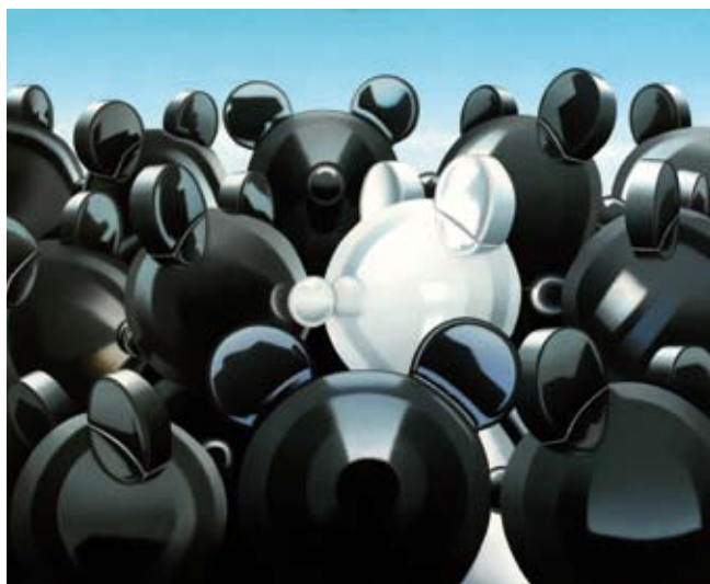
Juan Cuéllar 2009, 2009 Óleo sobre lienzo. 81 x 100 cm