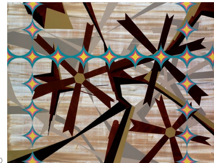
122 x 160 cm. Laca sobre madera. 2010