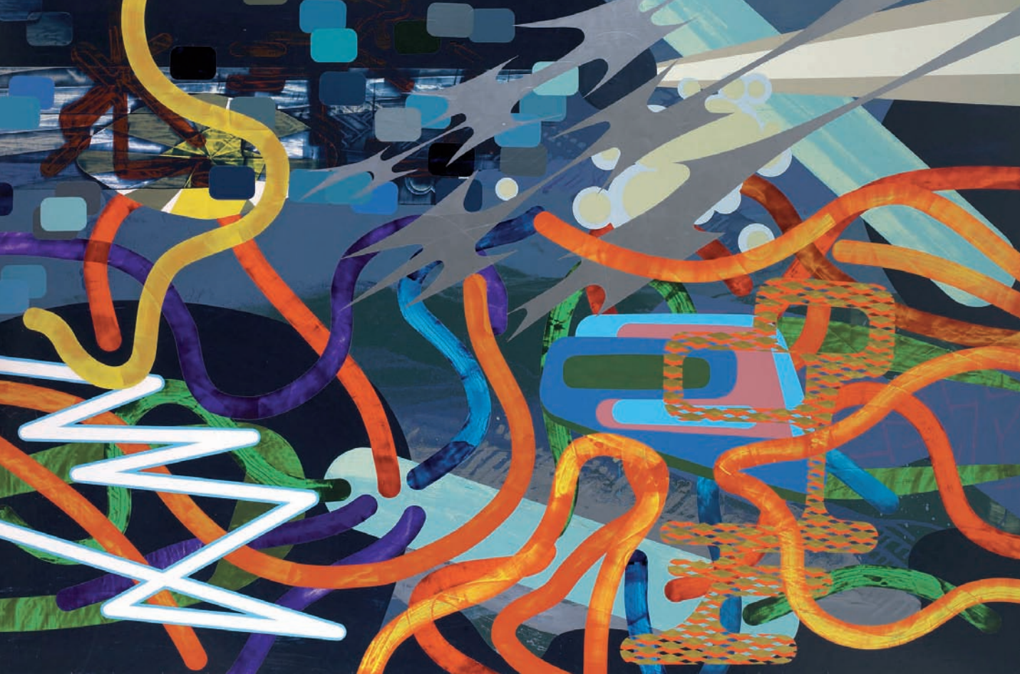
162 x 244 cm. Laca sobre madera. 2011