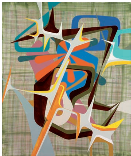
150 x 122 cm. Laca sobre madera. 2010

Y en efecto, considero que la pintura de Alfonso Sicilia podría definirse como pintura rizomática pues en ella advertimos muchas de las connotaciones descritas por estos dos autores.